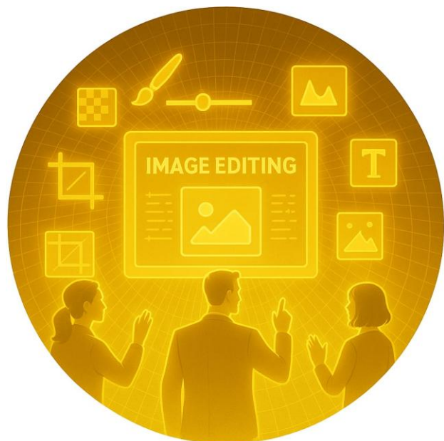
IMAGE EDITING /EDITAREA IMAGINILOR

Certificat obținut: Certificat de participare